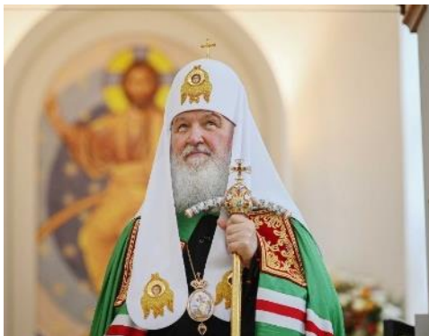
Русской Православной Церкви.

Предстоятеля Русской Православной Церкви Святейшего Патриарха Московского и всея Руси Кирилла. В этот день митрополит Ижевский и Удмуртский Викторин с духовенством и паствой вознесли молитвы о здравии Предстоятеля