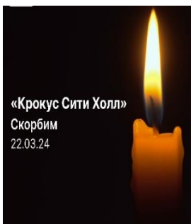
«Крокус Сити Холл» Скорбим 22.03.24