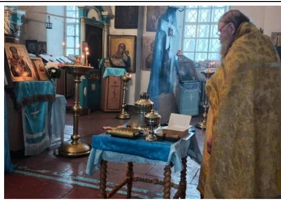
На снимках: колокол, о. Владимир освящает новый колокол.

С Рождеством, с Новым годом поздравили воинов учащиеся Большево-волковской школы . Вот такие письма написали они